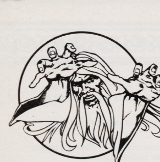
MERLIN the Wizard

U.S. Gold Ltd., Units 2/3 Holford Way, Holford, Birmingham B6 7AX. Telephone: 021 356 3388