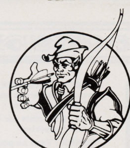
QUESTOR the Elf